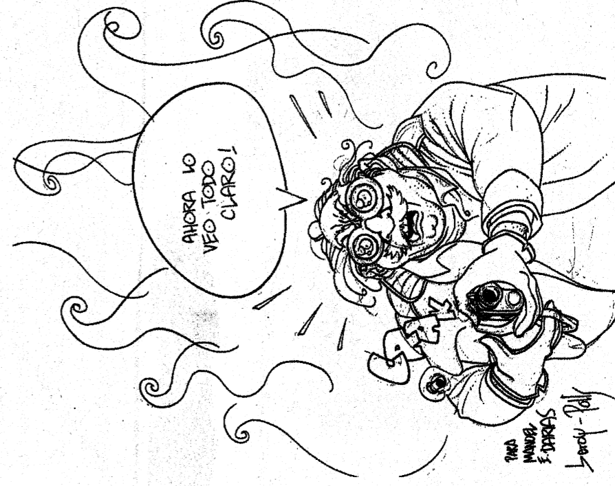
Dibujo de Beroy, especial para esta página (1994).

"Creo que el lector necesita ser sorprendido -me confesó